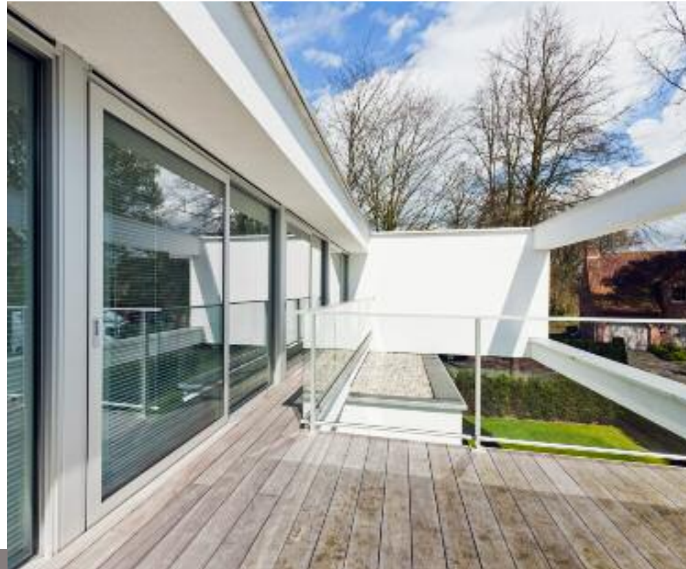
1 ^ Terrasplanken padoek: 70 - 120 euro/m 2 , incl. plaatsing, excl. btw

2 De voorkant van het huis bevat de meer functionele ruimtes en is volledig gesloten. Het uitspringende deel van de gevel en de kantelpoort werden bekleed met verticale stroken afrormosia.